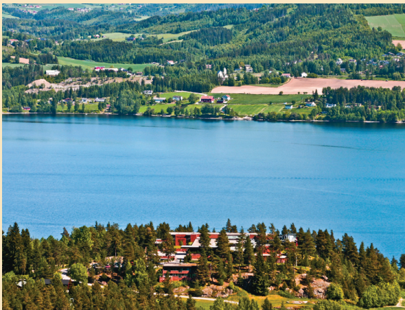
Halvorsbøle Internationale Retreatcenter

Anmeldung Web: http://www.acem.com/allobjects/acemcoursetype/international_deepening_retreat_in_no_rway